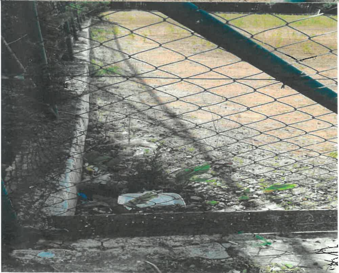
Areál bývalých tenisových kurtov na Bodvianskej ulici v Bratislave