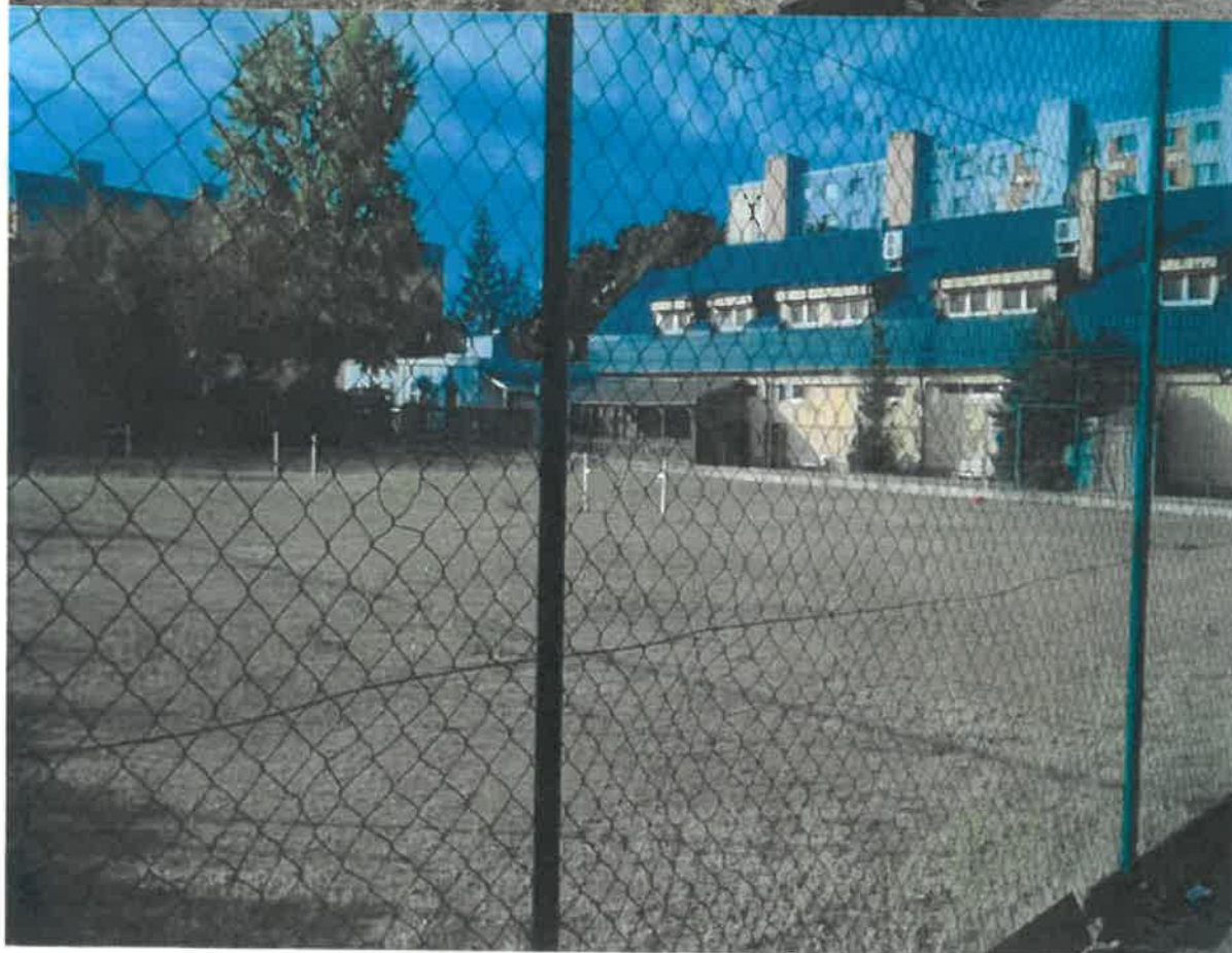
Areál tenisových kurtov na Bodvianskej ulici v Bratislave stav v roku 2018