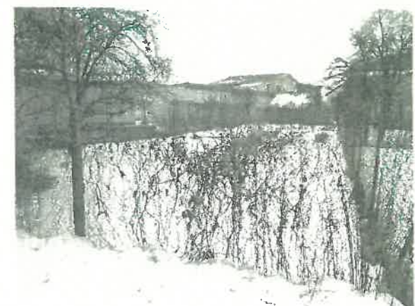
Pohľad na pozemky zo súkromnej komunikácie pri RD a pohľad na pozemok parc.č.2579