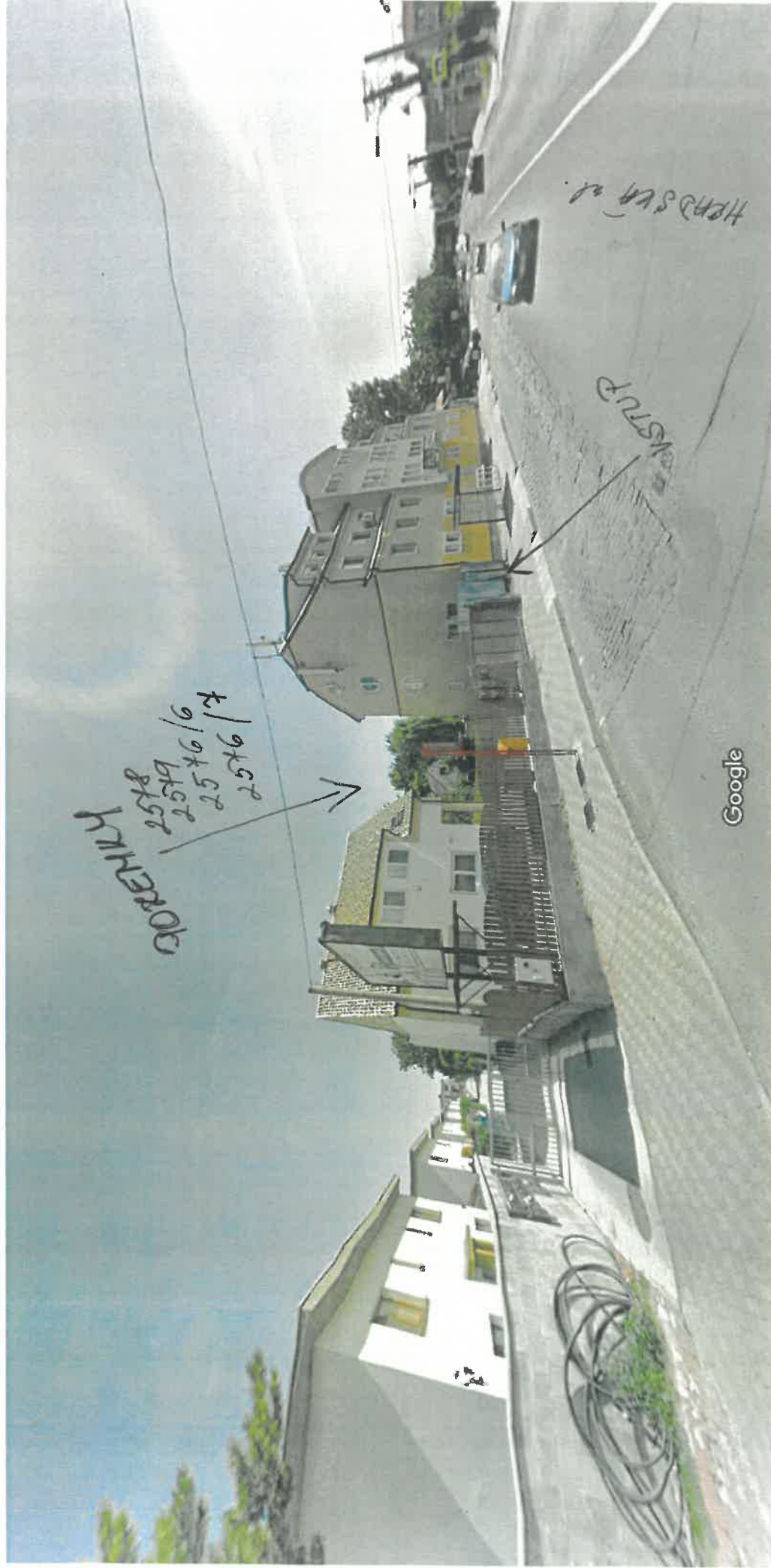
Vytvorenie snímky: jún 2018