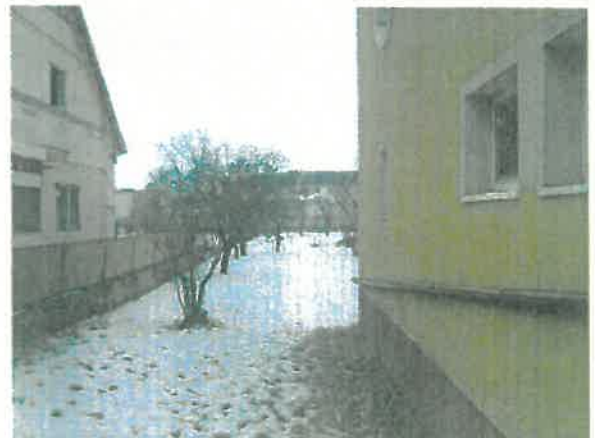
Podľad na bránu a pozemok parc.č.2578 za bránou.