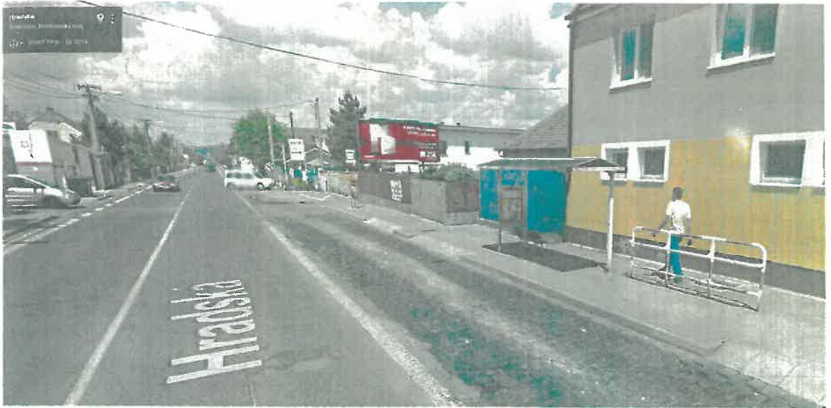
Prístup k pozemkom z Hradskej ulice cez modrú plechovú bránu