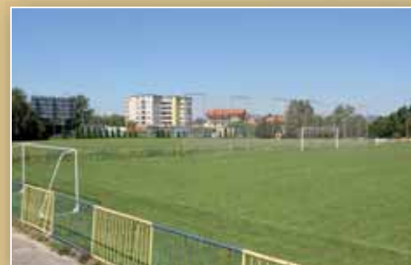
Zverenie pozemku v rámci športového areálu (str. 13)