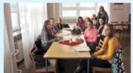
Metodické usmernenie poslucháčov

Deň, keď ukončia svoju prax na tejto škole poslucháči z Pedagogickej fakulty UK, je tiež veľmi významný. Aj tento školský rok sa tu pripravovalo na svoje budúce povolanie 47 učiteľov a 21 vychovávateľov. Prípravu budúcich učiteľov považuje vedenie školy za veľmi dôležitú, v mnohých smeroch aj motivujúcu, pri realizácii výchovno-vzdelávacieho procesu školy. Deň ukon-