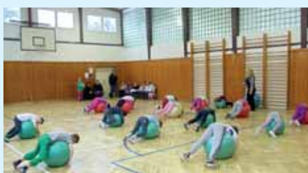
Netradičné pomôcky na hodine telesnej výchovy

Sú to dni, ktoré cielene usmerňujú chod školy a svojím zameraním rozhodujú o jej existencii v každom novom školskom roku. Vždy pred zápisom detí do 1. ročníka sprístupňuje škola svoje priestory pre rodičovskú verejnosť a pre rodičov budúcich prváčikov. V tento výnimočný deň, Deň otvorených dverí , sú realizované ukážky vyučovacích hodín. Škola v tento deň prezentuje program modernej výučby, prácu s interaktívnymi tabuľkami a dataprojektormi vo všetkých predmetoch, program výučby informatiky v komplexne vybavených učebniach