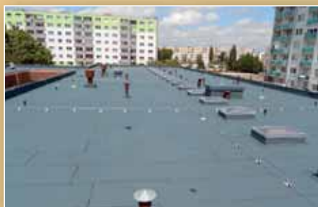
Rekonštrukcia zdravotného strediska (str. 11)