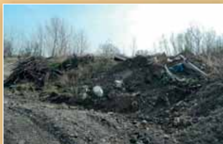
Nebezpečná skládka odpadu (str. 7)