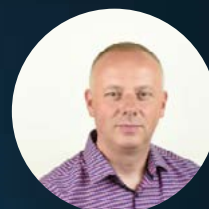
13. Vladimír Jánošík