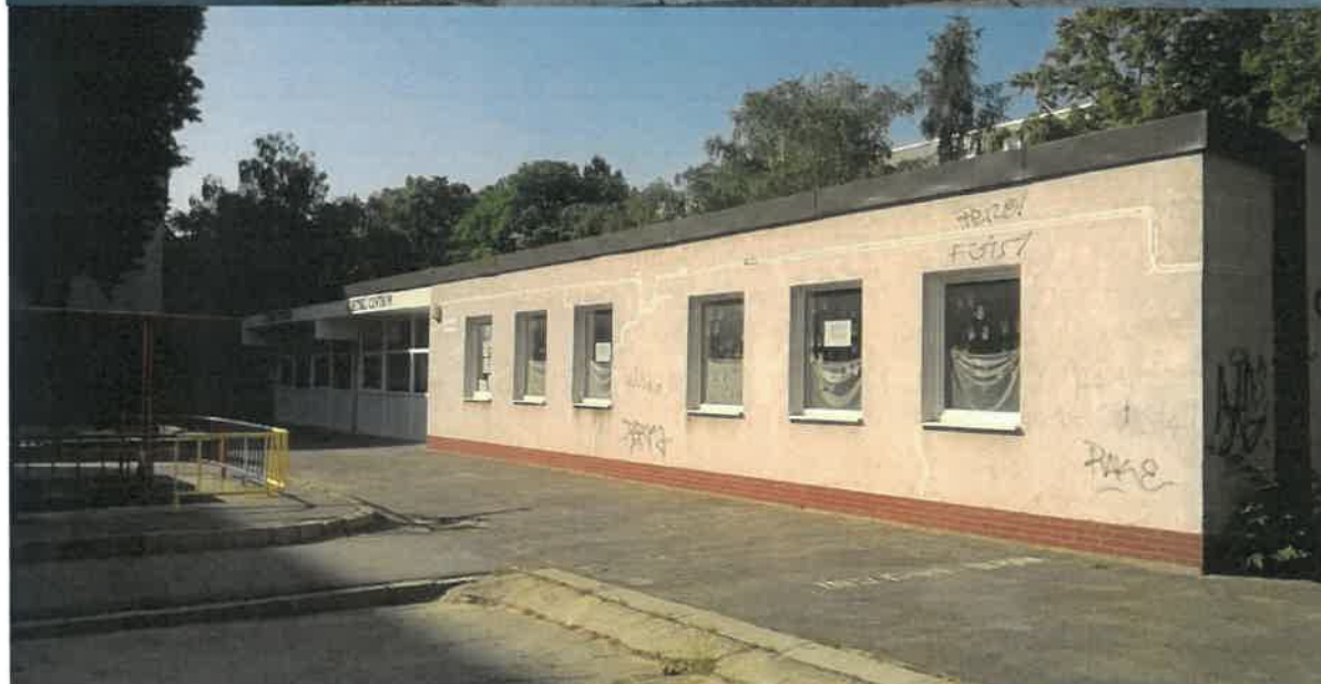
Stavba súpisné číslo 13507 na Čiližskej 26A v Bratislave - stav k 18.5.2020