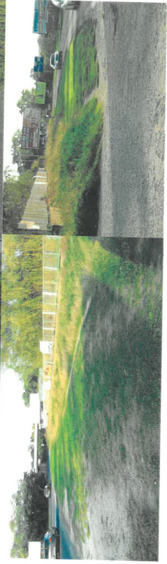
Pozemok parc. č. 889/4 a 889/9 na Ráztočnej ulici v Bratislave – pôvodne ako súčasť areálu BVS