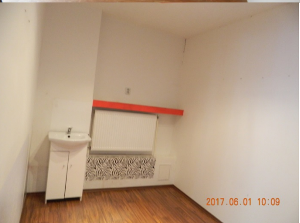
Objekt na Bodvianskej 21A, súpisné číslo 13506 v Bratislave – za bytovým domom na Bodvianskej 21 BA v dvornej časti pri garážach (bielohnedý objekt) Nebytové priestory – predmet nájmu - prvé naľavo – foto č. 1