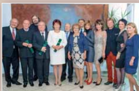
Poznáme osobnosti Bratislavy za rok 2013 (str. 5)