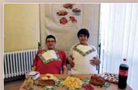
Hovorme o jedle! (str. 12)