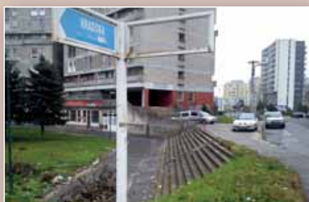
Kamerový systém vo Vrakuňi (str. 6)